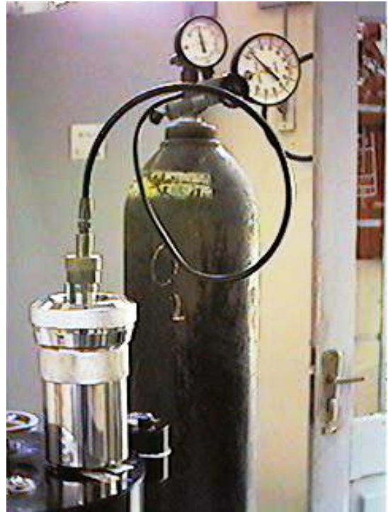
FIGURA 3. Cámara de reacción o bomba del calorímetro recibiendo el oxígeno a 20 atmósferas

El calor evolucionado a presión constante Q_p es igual a la variación de entalpía \Delta H , una magnitud que depende solamente de los estados inicial y final del proceso, y no de la forma en que éste se lleva a cabo (lo que se conoce en termodinámica como una función de estado ). El resultado final es un número, el calor de reacción o calor de combustión , que da una medida de la bioenergía almacenada en la sustancia y de su capacidad para convertirse en trabajo útil. Como la variación de entalpía no depende de la forma en que la combustión se lleve a cabo, se pueden comparar energéticamente procesos que a primera vista pudieran parecer muy disímiles. Por ejemplo, es posible calcular sin