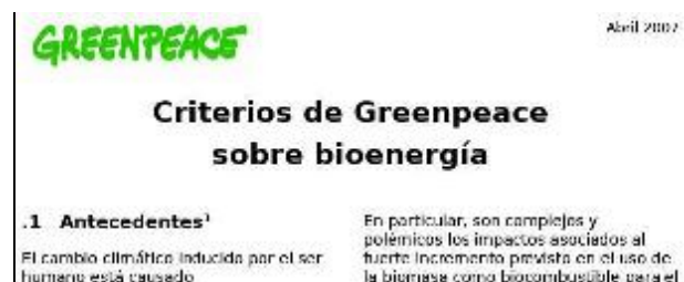
FIGURA 1. www.greenpeace.org/raw/content/espana/reports/criterios-de-greenpeace-sobre.pdf

alegan que las nuevas tecnologías podrían hacer rentables una amplia variedad de posibles materias primas y desechos agrícolas, tales como los tallos del propio maíz y la paja de cereales.