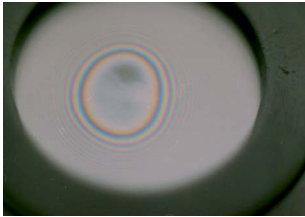
FIGURA 2. Anéis coloridos, formados pela incidência de luz branca sobre um sistema de lentes.

A explicação para a formação dos anéis coloridos em películas finas por meio do modelo de vibrações do éter permite uma compreensão qualitativa do fenômeno. No entanto, esse modelo apresenta alguns problemas. O primeiro deles refere-se ao fenômeno da reflexão total do raio de luz, em sua passagem por um meio mais denso (por exemplo, o vidro) para um meio mais rarefeito (por exemplo, o ar). Se os raios de luz sempre provocam vibrações nas partículas de éter presentes nos corpos, as quais ora os refletem ora os transmitem, não fica claro como essas vibrações agiriam para refletir todos os raios a uma determinada inclinação destes em relação à normal com a superfície refratora. Newton não discutiu essa questão.